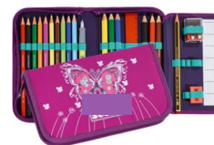
Astuccio con elastici